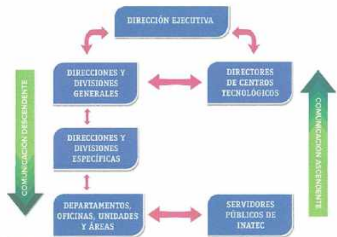
Figura #2 Flujo de la Comunicación e Información - INATEC

De acuerdo al esquema del Flujo de la Comunicación del INATEC, se identifica que la máxima autoridad es el primer y principal canal de comunicación, ésta a